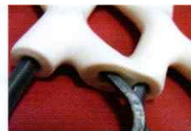
厚膜PVCコーティング

独自技術の厚膜PVCコーティングにより、四肢に優しい動物用のスノコを実現しました。また、保冷剤の急激な冷温はPVC樹脂で断熱され、緩やかな冷気が動物に伝わる構造です。